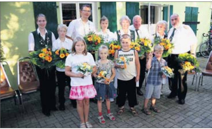
Blumen, Orden und Ehrenzeichen erhielten die Nordholzer Majestäten.